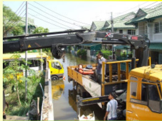
จังหวัดนนทบุรี