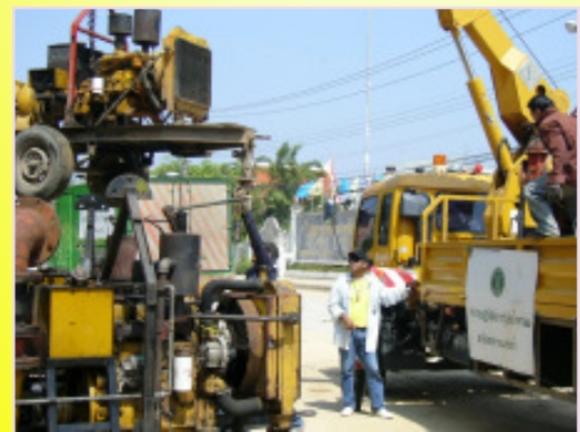
จังหวัดอ่างทอง