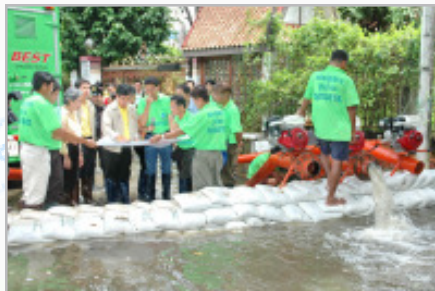
ผู้ว่าราชการกรุงเทพมหานคร พร้อมคณะผู้บริหารสำนักการระบายน้ำตรวจสภาพน้ำท่วม บริเวณถนนลาดพร้าวช่วง ซอยลาดพร้าว 91, 101 และ 107 วันที่ 12 ตุลาคม 2550