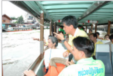
ผู้ว่าราชการกรุงเทพมหานคร พร้อมคณะผู้บริหารสำนักการระบายน้ำตรวจสภาพน้ำ และการก่อสร้างแนวคันกันน้ำ บริเวณคลองบางกอกน้อย และแนวริมแม่น้ำเจ้าพระยา วันที่ 7 ตุลาคม 2550