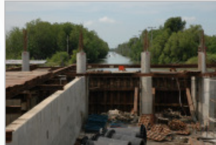
ผู้ว่าราชการกรุงเทพมหานคร พร้อมคณะผู้บริหารสำนักการระบายน้ำตรวจการก่อสร้างสถานีสูบน้ำคลองขุนราชพินิจใจ ของโครงการแก้มลิงคลองมหาชัย - คลองสนามชัย วันที่ 15 กันยายน 2550