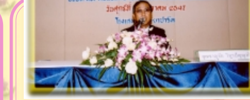
สนน.จัดสัมมนาเชิงวิชาการ โครงการจัดทำระบบทำนายน้ำท่วมเนื่องจากฝน ณ ห้องแกรนด์รีซิดาบอลลุ่ม โรงแรมเจ้าพระยาปาร์ค เมื่อวันที่ 29 ต.ค. 47