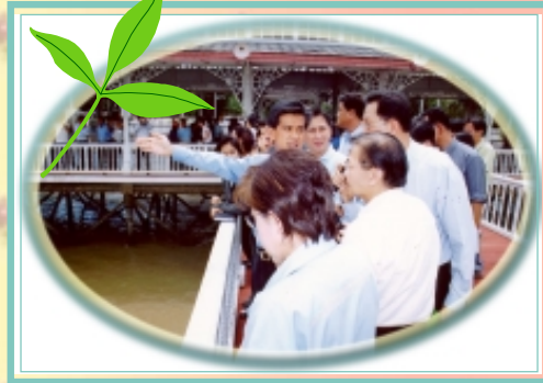
นายอภิรักษ์ โกษะโยธิน ผว.กทม. พร้อมด้วยนายสามารถ ราชพลสิทธิ์ รพว.กทม. ลงพื้นที่ตรวจโครงการก่อสร้างระบบระบายน้ำ ตามสถานที่ต่าง ๆ ของสำนักการระบายน้ำ โดยมี ผอ.สนน. บรรยายชี้แจง เมื่อวันที่ 11 ก.ย. 47