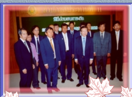
" พบกันจันทร์ละหนคนกับข่าว " นายไชยยุทธ ณ นคร ร.ป.ทท.พร้อมด้วย นายธีรเดช ตั้งประภทธีกุล ผอ.สนน. เป็นประธาน การแถลงข่าวเรื่องการป้องกันและแก้ไขปัญหาน้ำท่วม เนื่องจากน้ำฝน น้ำเหนือ และน้ำทะเลหนุน ที่ศาลาว่าการกรุงเทพมหานคร เมื่อวันที่ 18 ต.ค. 47