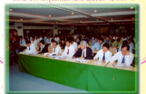
สนน.จัดสัมมนาเชิงวิชาการ โครงการจัดทำระบบทำนายน้ำท่วมเนื่องจากฝน ณ ห้องแกรนด์รีซิดาบอลลุ่ม โรงแรมเจ้าพระยาปาร์ค เมื่อวันที่ 29 ต.ค. 47