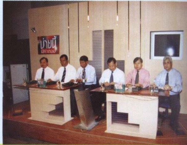
รายการข่าวที่มีคำตอบ ร่วมกับสำนักงานระบายน้ำ จัดสนทนาในหัวข้อ "การป้องกันน้ำท่วม" 11 มิ.ย. 47