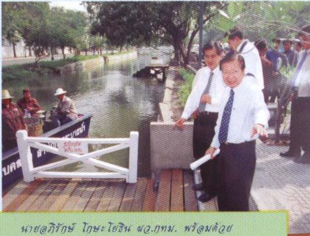
นายอภิรักษ์ โกษะโยธิน ผอ.กทผ. พร้อมด้วย นายธีรเดช ตั้งประพุกทักฎ ผอ.สนท. และคณะผู้บริหาร สำนักการระบายน้ำ ตรวจทำเนื่อ ทำน้ำ เพื่อเตรียม ความพร้อมในเทศกาลออกขกรรมทง 10 พ.ย. 47