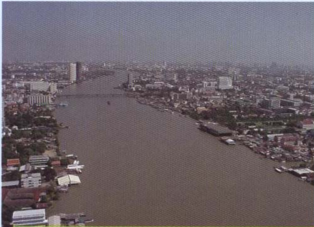
ภาพน้ำแม่เจ้าพระยา ที่ไหลผ่านกรุงเทพมหานครจนถึงหน้าวัดอโศก ปี 2547