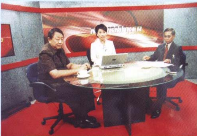
รายการคนในข่าว จัดสนทนาเรื่อง "น้ำเสีย...มลพิษทางน้ำที่อโศกบำบัด" ทางช่อง 11 NEWS 1 28 ก.ค. 47