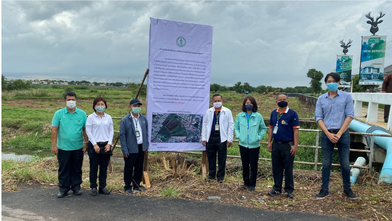
บริเวณริมคลองตัน